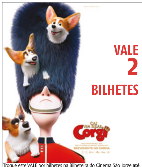
Troque este VALE por bilhetes na Bilheteira do Cinema São Jorge até dia 17 de março. Sujeito à disponibilidade de lugares.

Os bilhetes deverão ser adquiridos na bilheteira do respectivo cinema.