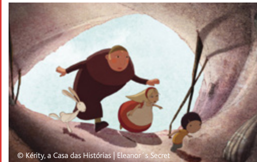
Eleanor's Secret

Nathaniel, garoto de sete anos, passa as férias de verão na casa à beira-mar que os seus pais herdaram da velha tia Eleanor. Durante a estadia, recebe como presente uma biblioteca antiga e descobre que os livros são mágicos e ganham vida quando cai a noite.