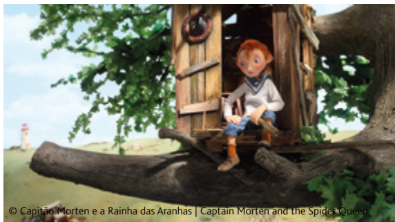
© Capitão Morten e a Rainha das Aranhas | Captain Morten and the Spider Queen

14H30 | SALA MANOEL OLIVEIRA | COMPETIÇÃO DE LONGAS (VO LEG. PT)