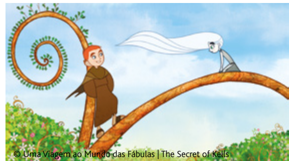
© Uma Viagem ao Mundo das Fábulas | The Secret of Kells

No século IX, numa zona remota da Irlanda, situa-se o mosteiro de Kells, onde vive Brendan, um rapaz de 12 anos. Com a chegada do Irmão Aidan, famoso mestre da iluminação e guardião de um livro extraordinário mas inacabado, Brendan começa uma vida de aventura.