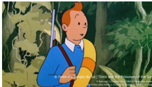
© Tintin e o Templo do Sol | Tintin and the Prisoners of the Sun

Uma equipa de aventureiros encontra o túmulo de Rascar Capac e, na sequência disso, todos são atacados por uma estranha doença que os põe a dormir. Ao mesmo tempo, o famoso Professor Tornesol é raptado por índios e levado para o Peru. Tintim é chamado para resolver o mistério. Música original de Jacques Brel.