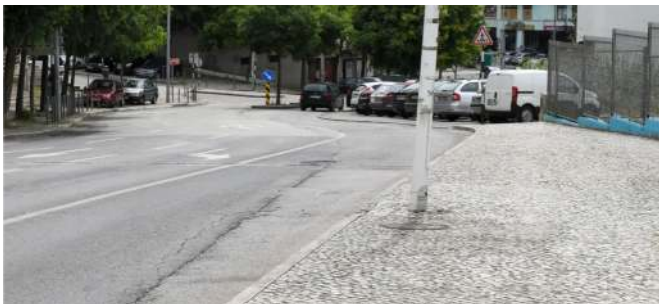
Requalificação da via pública na Rua Cruz Vermelha.