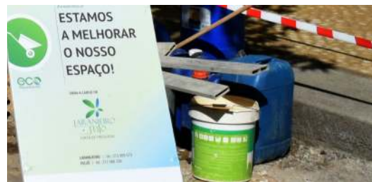
Regularização da calçada na Rua José Carlos de Melo.