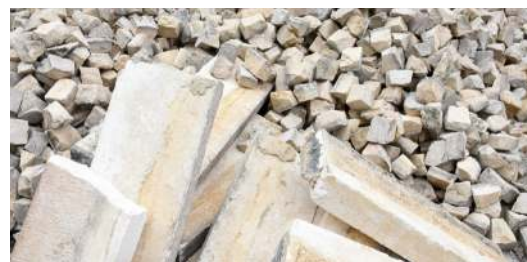
Regularização da calçada na Rua Dr. António Elvas.