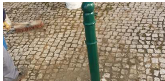
Reparação de calçada e pilarete na Rua Oliveira Martins.