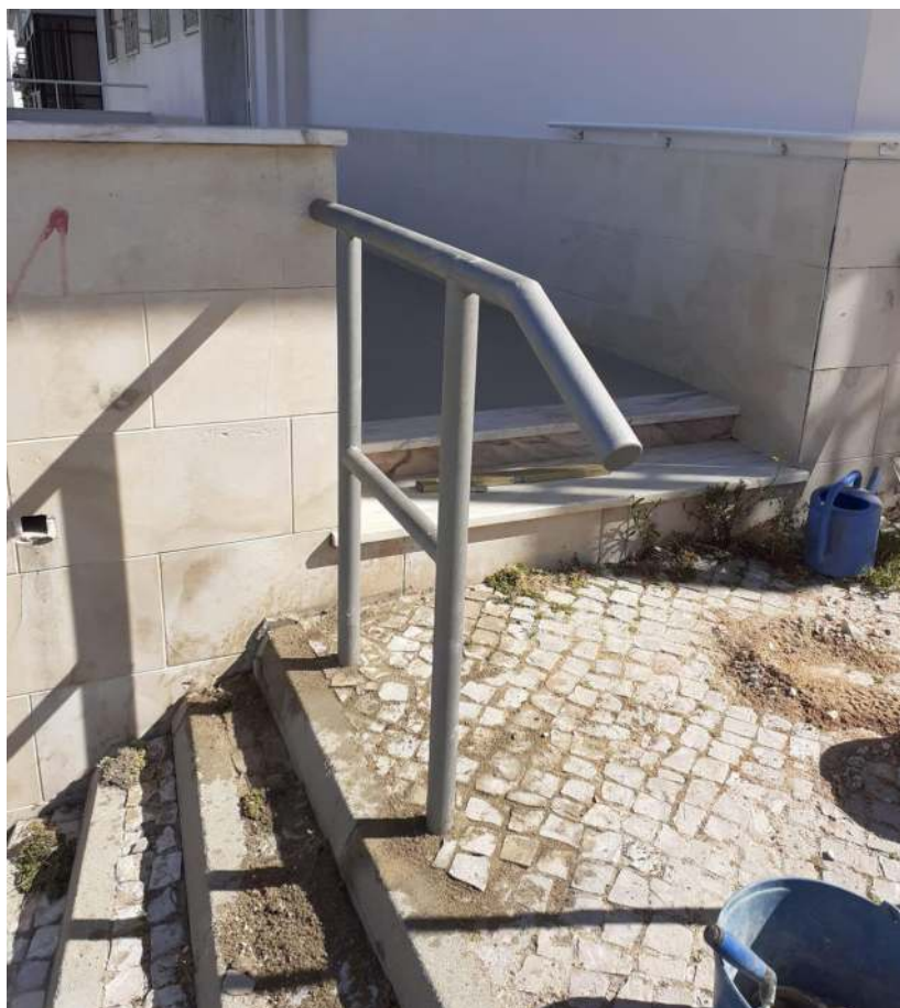
Instalação de um corrimão de segurança para melhoria da mobilidade da Rua Carolina Micaelis com a Rua Adolfo Coelho.