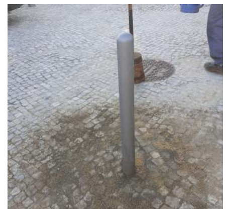
Regularização da calçada e colocação de pilaretes na Rua Afonso Paiva.