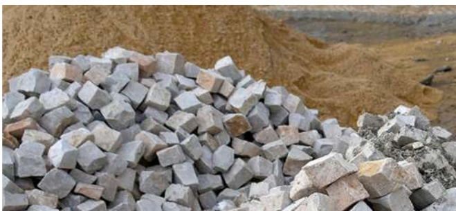
Reparação de calçada na zona da paragem de metro António Gedeão.