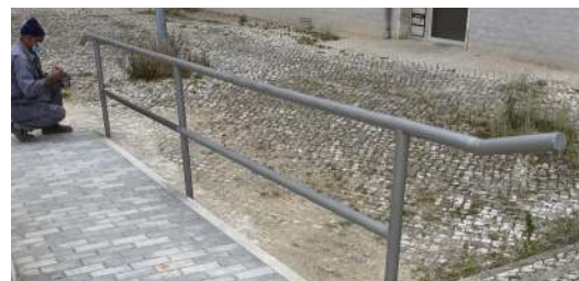
Colocação de um corrimão na Praceta Ana Osório.