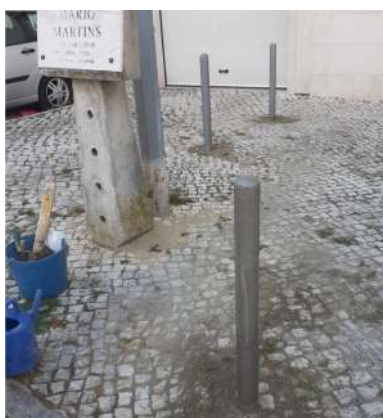
Regularização da calçada e colocação de pilaretes na Rua Mário Martins.