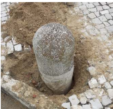
Reparações de calçada e "frade" na Rua Maria Judite de Carvalho.