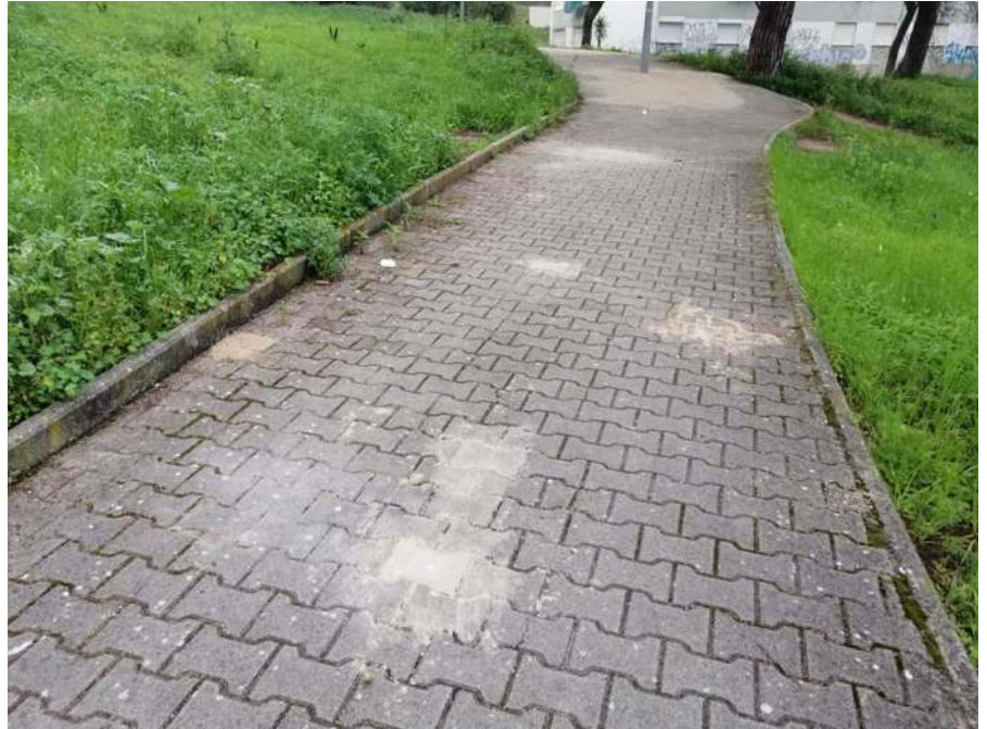
Passagem pedonal entre a Avenida 23 de Julho e a Rua Filipe Folque.