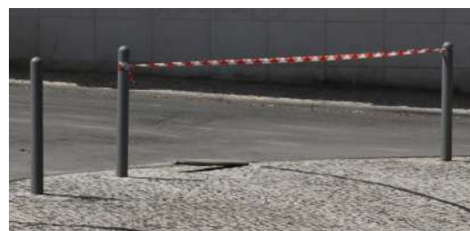
Reparação de calçada e pilarete na Avenida Arsenal do Alfeite.