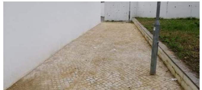
Colocação de Calçada e grelha na Praceta Dr. Barbosa du Bocage.