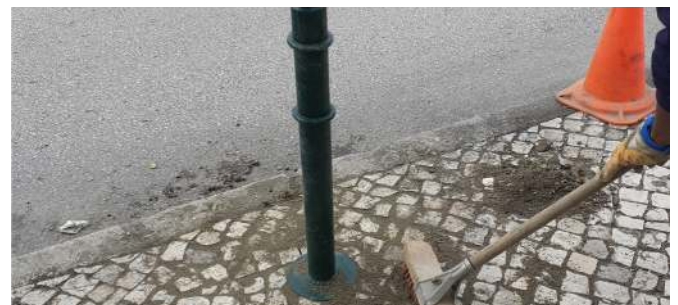
Regularização da calçada e reparação de pilarete na Rua António Elvas.