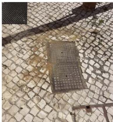
Regularização de calçada na Praceta Oliveira Martins.