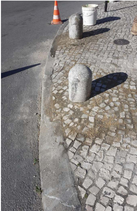
Regularização da calçada e reposição de frades na Rua Dr. António Elvas.