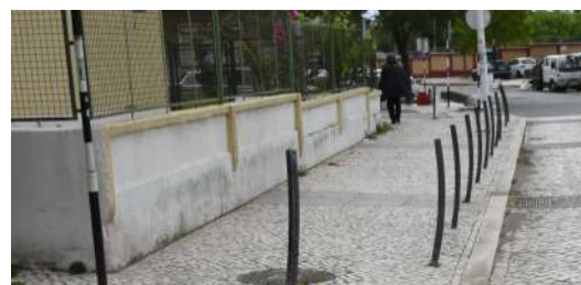
Requalificação da via pública na Praça da Portela.