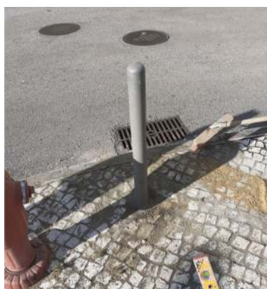
Regularização da calçada e reparação de pilarete na Rua Maria Judite de Carvalho.