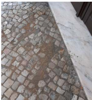
Regularização da calçada na Rua Afonso Paiva.