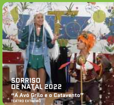
SORRISO DE NATAL 2022 "A Avó Grilo e o Catavento" TEATRO EXTREMO

durante a quadra natalícia, sendo acompanhado pelos membros da Junta de Freguesia nas diversas atuações nas escolas, onde deixam sempre a sua mensagem de reconhecimento à Comunidade Educativa pelo trabalho realizado e esperança num futuro melhor que todos ajudarão a construir.