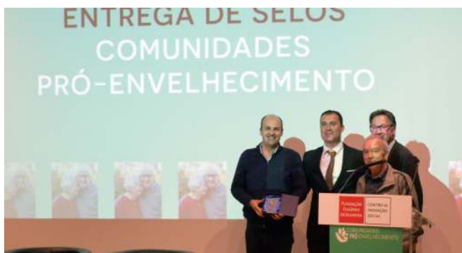
SELO COMUNIDADES PRÓ ENVELHECIMENTO PELA SEGUNDA VEZ