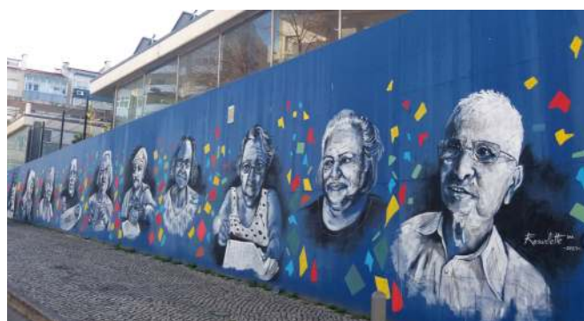
MURAIIS QUE BRILHAM NA FREGUESIA