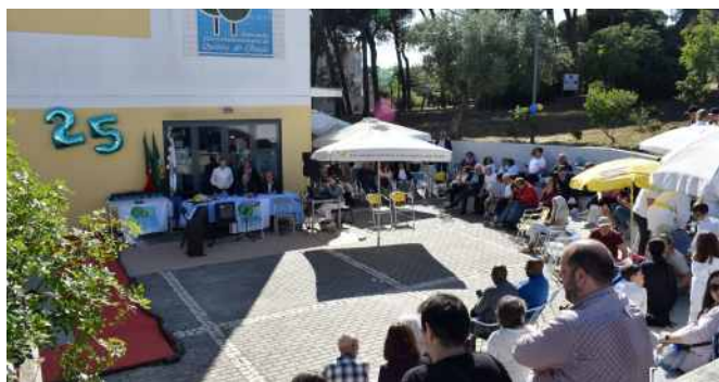
Celebrações do 25.º aniversário da AD Quinta do Chiado