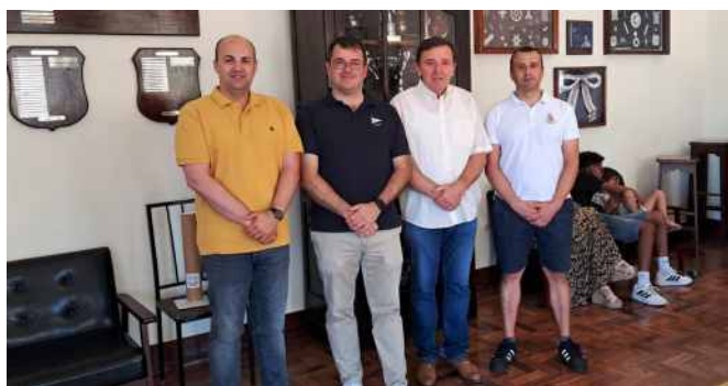
Open Day assinalou o 136.º Aniversário do CNOCA