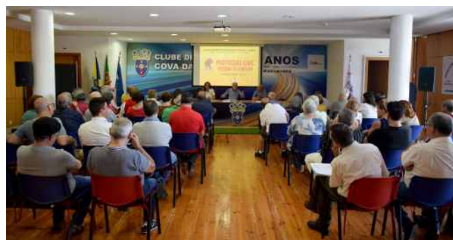
Debate "Proteção Civil - Prevenir ou Remediar", pelas Escolas do Desp. da Cova da Piedade