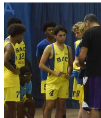
Torneio de Basquetebol Prof. Abílio Lopes, edição 2024