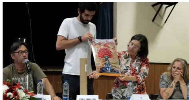
80.º Aniversário do Clube Recreativo do Feijó