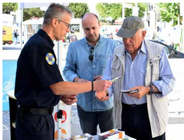
Ação da Protecção Civil na Praça Portela