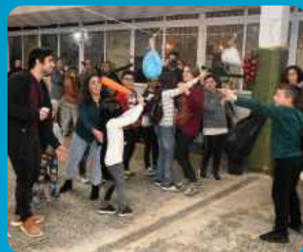
Construções Norte Sul