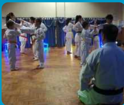
Clube Recreativo do Feijó