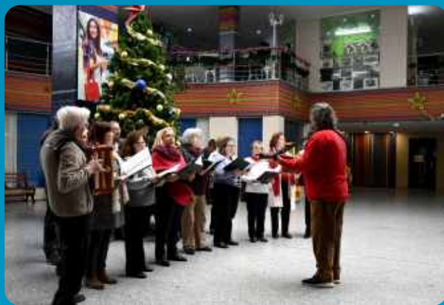
Cânticos de Natal