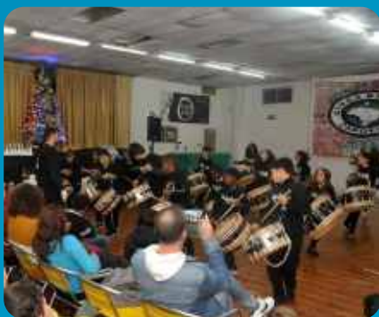
Estrelas do Feijó