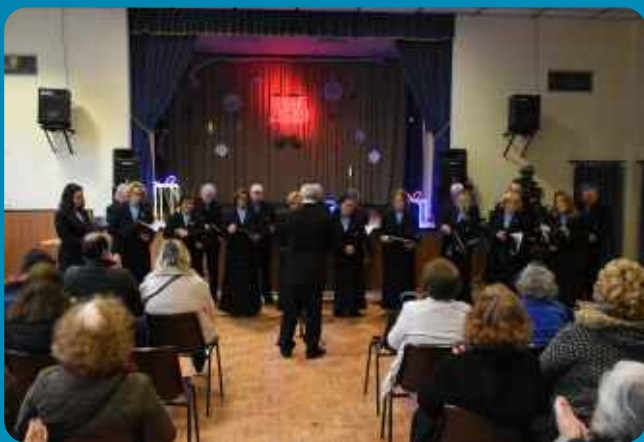
Concerto de Natal